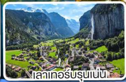
เลาเคอร์บรุนเนน