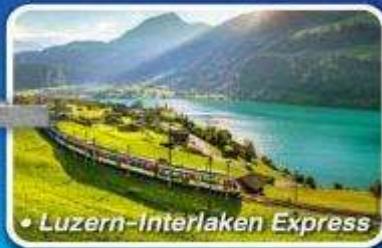
• Luzern-Interlaken Express