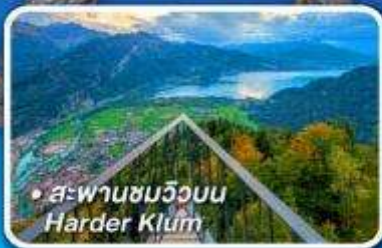
• สพานขมวิวนน Harder Klamm