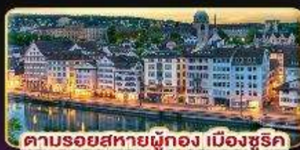
คาบรอยสหายผู้ทอง เมืองซูริค