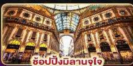
ช้อปปิ้งมิลานจุใจ

🚗 เดินทาง : 9-16 ก.พ. / 9-16 มี.ค. / 23-30 มี.ค. 88