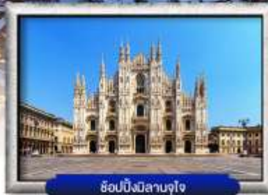
ช็อบบิงมีลาเนาจูเอ