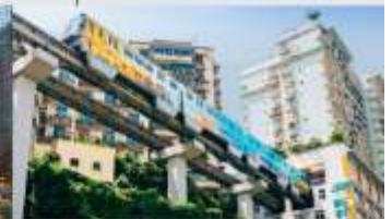
รถไฟฟ้าทะเลตึก

*ทางบริษัทฯ ขอสงวนสิทธิ์ในการสลับโปรแกรมทัวร์ตามความเหมาะสมขึ้นอยู่กับสถานการณ์ปัจจุบัน โดยคำนึงถึงผลประโยชน์ของลูกค้าเป็นสำคัญ