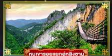
หุบเขารอยแยกอุทิงซาบ