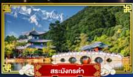
สระมิงกรค่า