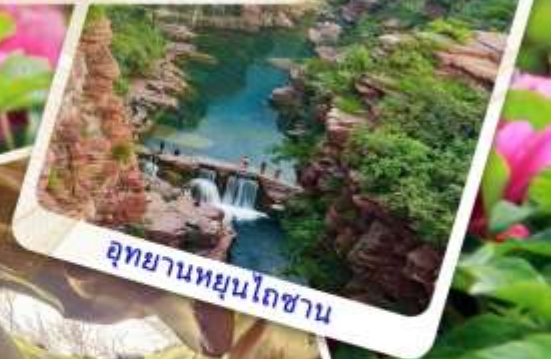
อุทยานหยุนโถซาน

ถ้ำผาลองเหมิน - สวนดอกโบตั๋น - อุทยานหยุนโถซาน - ถ้ำน้ำแข็งหมื่นปี - น้ำตกหูโจว - แกรนด์แคนยอนหยูฉา โกว - สุสานทหารดินเผาฉินซี - กำแพงเมืองซีอาน - ห้าง XIAN MIX C MALL - ถนนคนเดินต้าถิง - POP MART