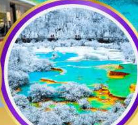
อุทยานหลวงหลง