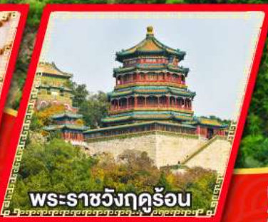
พระราชวังกุจื้อน