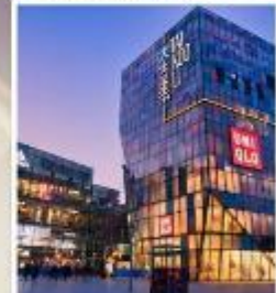
ย่านซานหลี่ถุน