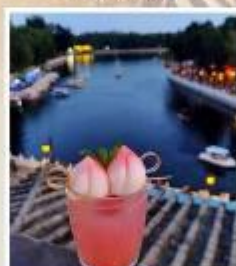
TANG FANG CAFE