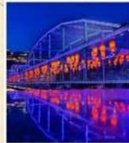
สะพานหวงเหอ ตี้อี้เจียว