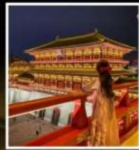
ท่าแพงอังก์เทียนเหมิน