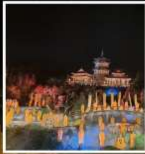
โชว์ SHAOLIN MUSIC CEREMONY