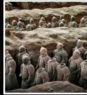
พิพิธภัณฑ์กองทัพใต้ดิน ทหารม้าจีนซี