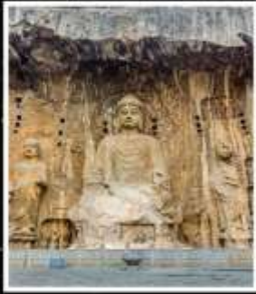
พระพุทธรูปแกะสลัก หินหลงเหมิน