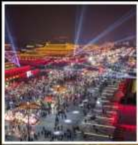
ถนนคนเดินวัฒนธรรมต้าถิง