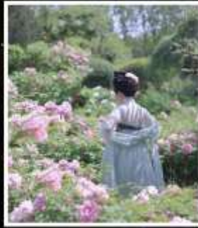
เทศกาลดอกโบตั๋น