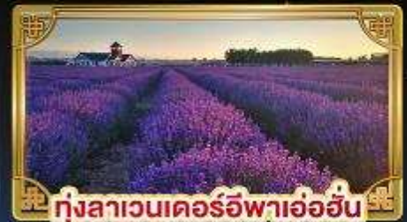
ทุ่งลาเวนเดอร์อิฟาอ้อฮั่น