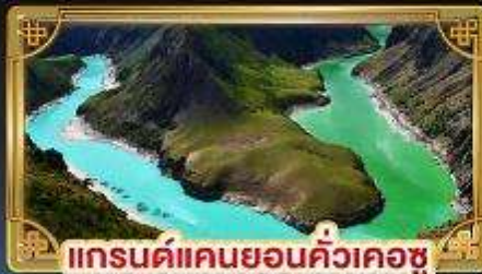
แกรนด์แคนยอนคิ้วเคอซู