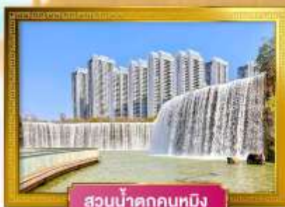
สวนน้ำตกคุนหมิง