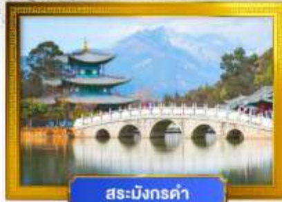
สระมังกรดำ