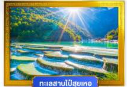
ทะเลสาบไป๋สฺยเหอ