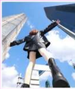
3 ตึกใหญ่ แห่งเมือง เซี่ยงไฮ้