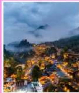
หุบเขาเทวดาวังเซี่ยนทู่