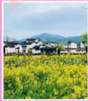
หมู่บ้านโบราณเฉิงชาน