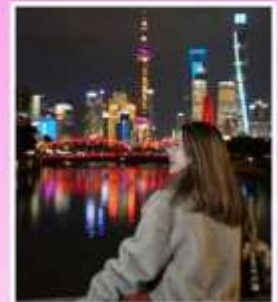
สะพานจ๋าฟู่ตู้เซี่ยอ