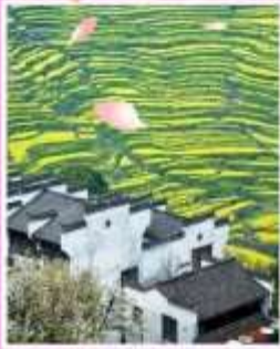
หมู่บ้านโบราณหวงหลิ่ง