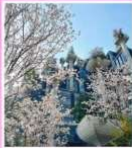
TIAN AN 1,000 TREES SQUARE