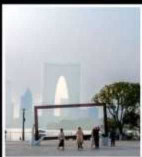
SUZHOU LARGE PHOTO FRAME