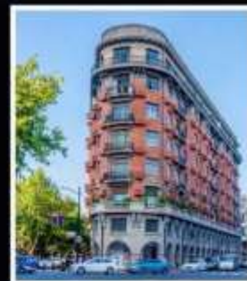
ถนนอู่คิง