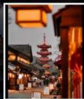
หมู่บ้านเหมียนฮวาวาน