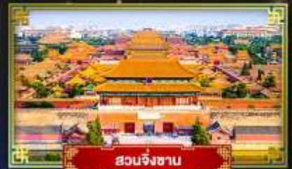
สวนจิ่งซาน