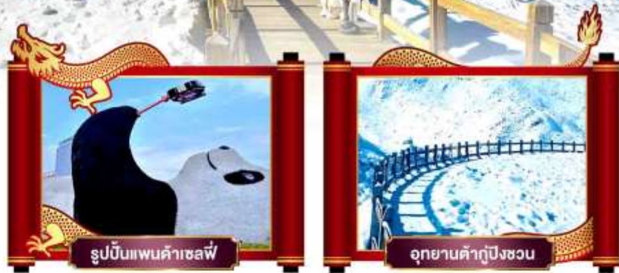
รูปปั้นแพนด้าเซลฟี่