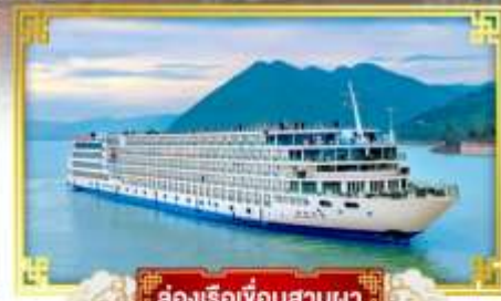
ล่องเรือเขื่อนสามผา