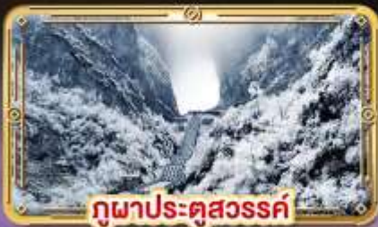
ถ้ำประตูสวรรค์