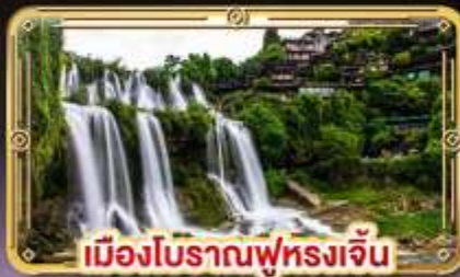
เมืองโบราณฟุทงเจิน