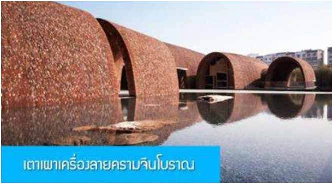
เตาเผาเครื่องลายครามจีนโบราณ