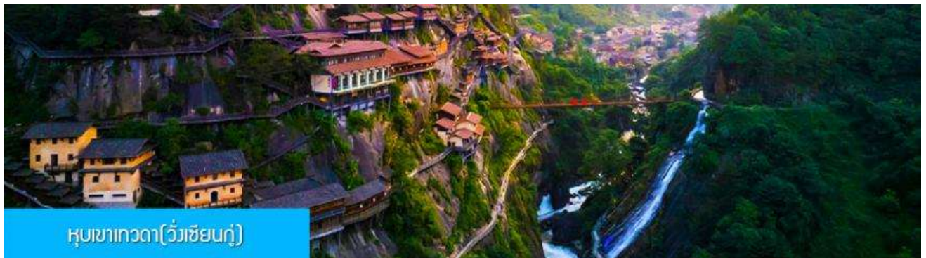
หุบเขาเทวดา(วังเซียนกู่)

หลังอาหารเช้าเดินทางสู่เมือง ซังเหรา 上饶 (ระยะทาง 127 กม. ใช้เวลาเดินทางโดยรถบัสราว 2 ชั่วโมง)