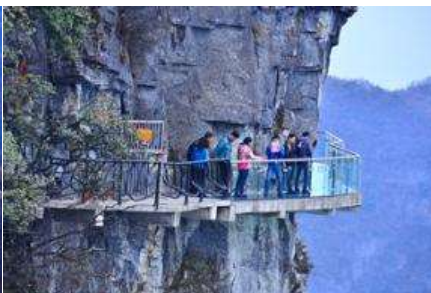
หน้าพาลอยฟ้ากาวเดินกระฉก