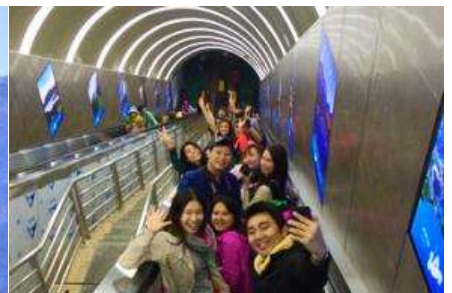
บันไดเลื่อนทะลุภูเขา