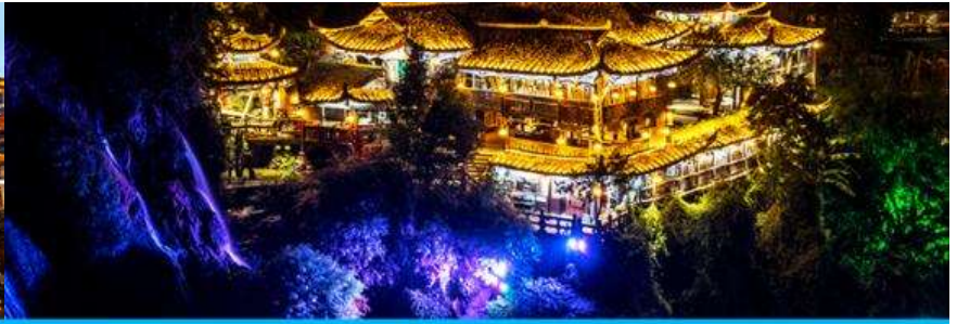
เมืองโบราณฟู่หรงจิ้น