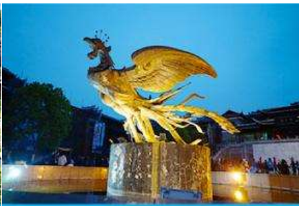
เมืองโบราณฟู่หรงจิ้น