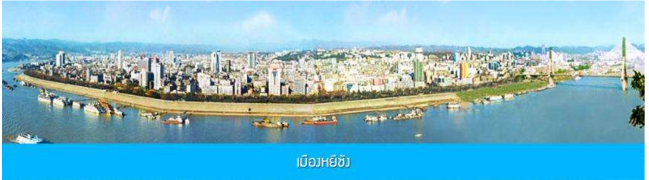
เมืองหยี่ชัง