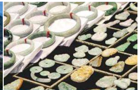
ศูนย์จำหน่ายผลิตภัณฑ์หยก

วันที่หก เมืองจางเจียเจี๋ย - เลือกซื้อโปรแกรมทัวร์เสริม(สะพานกระจกข้ามหุบเขาแกรนด์แคนยอน) – ร้านหยก-ร้านใบชา – เดินทางกลับเมืองหยีซัง