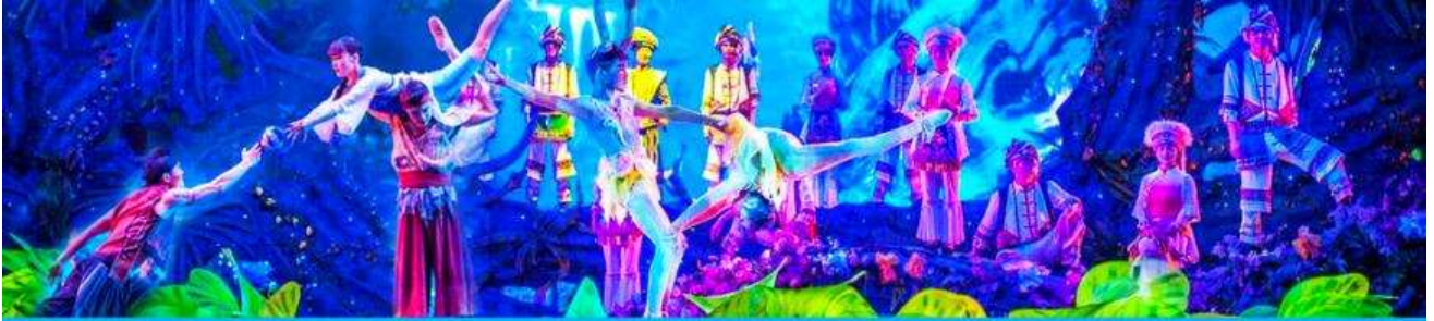
โชว์ The Charming Xiangxi

หลังอาหารนำท่านเดินทางเข้าที่พัก หรือท่านสามารถเลือกซื้อ โปรแกรมเสริม เป็นบัตรชมการแสดง ชุด The Charming Xiangxi หรือที่เรียกกันในหมู่นักท่องเที่ยวไทยว่า โชว์เมย์ลี่เซียงซี เป็นการแสดงในโรงละครขนาดใหญ่ที่จุผู้ชมได้กว่า 3100 คน/รอบ ใช้ทุนสร้างกว่า 2,300 ล้านบาท เป็นหนึ่งในการแสดงที่น่าดูชมที่สุดในเมืองจางเจียเจี๋ย แต่ละครการแสดงมีการออกแบบเวที จากประกอบที่พิถีพิถัน ประณีต และอลังการ ใช้ทีมงานนักแสดงหลายร้อยคน และระบบแสง สี เสียงที่ทันสมัยประกอบในการแสดง