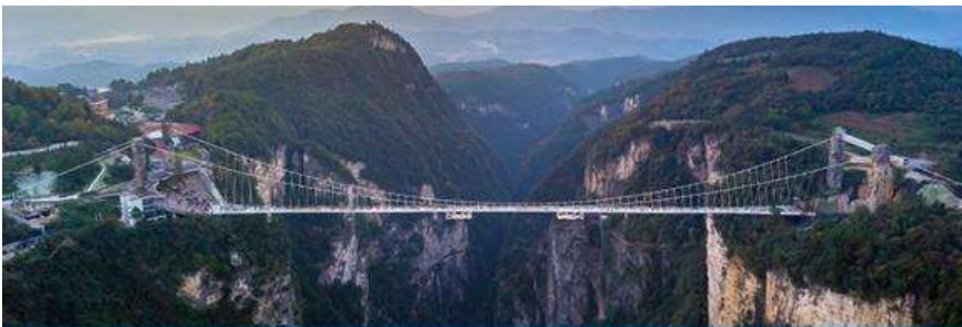
สะพานกระจกจางเจียเจี๋ย

พักที่ GUIYUANZHENPIN HOTEL / SAINA HEBAN HOTEL โรงแรมระดับ 4 ดาวหรือเทียบเท่าในอุทยานหวู่หลิงหยวน