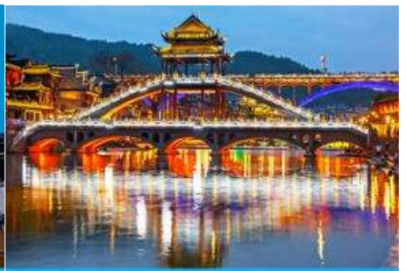
สะพานหงเจียว