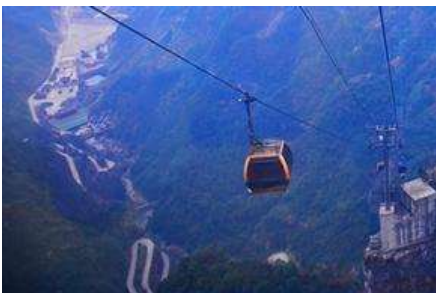
กระเช้าขึ้นเขียบเหวินชาน

โรงแรมระดับ 4 ดาวท้องถิ่นหรือเทียบเท่าในเมืองฟ่งหวง