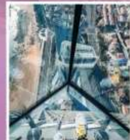
QINGDAO HAITIAN CENTER