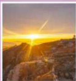
ยอดเขาอวิ้อวาง