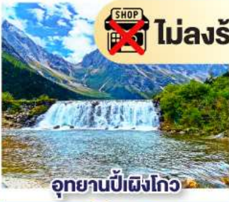
อุทยานปี้เผิงโกว