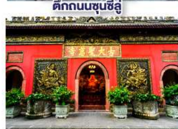
วัดต้าฉิว