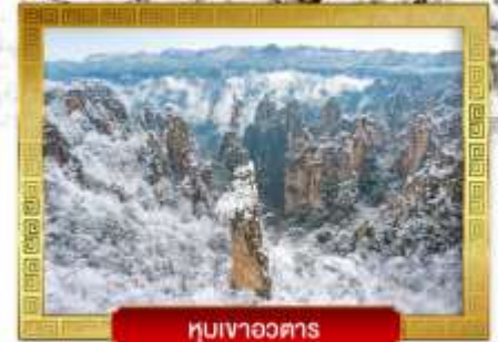
หุบเขาอวตาร