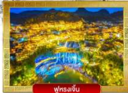
ฟุรงเจิน