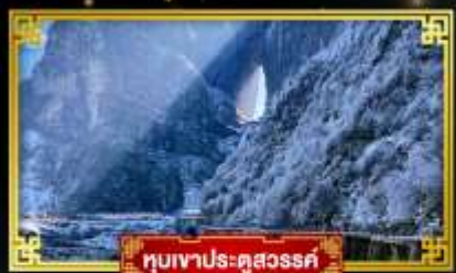
ทิวเขาประตูละออ