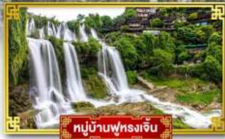
หมู่บ้านฟุทงเจิ้น