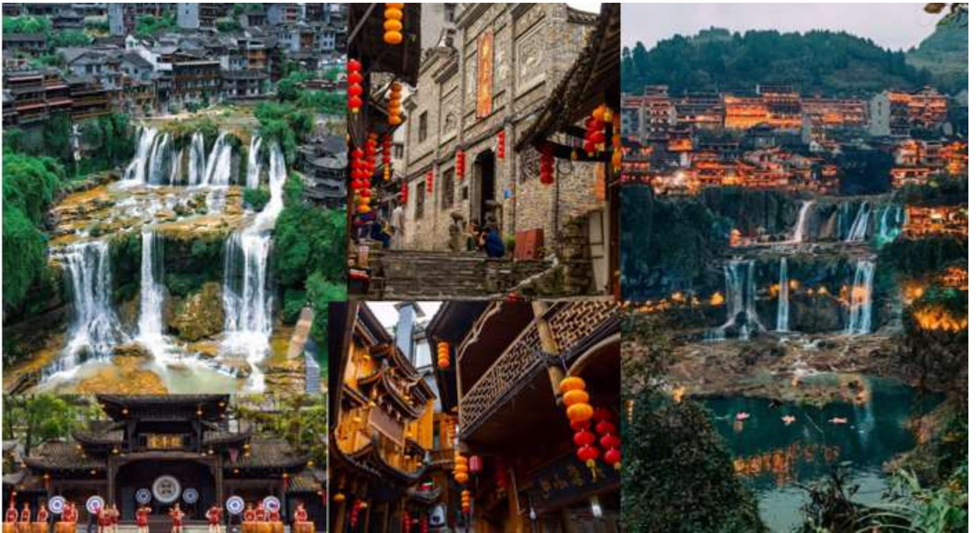
กลางวัน รับประทานอาหารกลางวัน ณ ภัตตาคาร (เมื่อที่ 9)