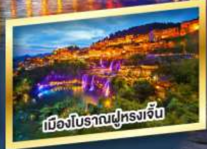
เมืองโบราณฟูหลงเจิ้น