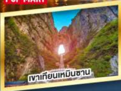
เขาเทียนเหมินซาน