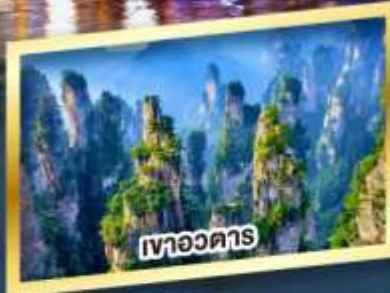
เขาอวตาร