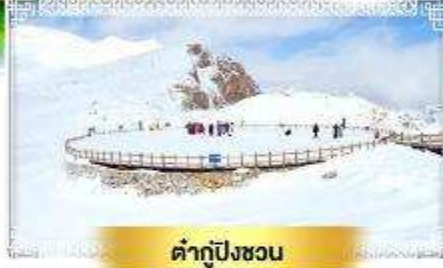
ต้ากู่ปิงชวอ