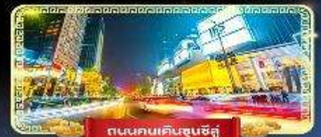
ถนนคนเดินชุนชิว