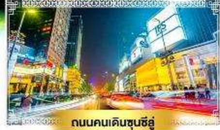
ถนนคนเดินชุนซีอู่