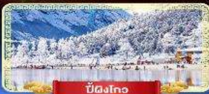
ปี้ดิงโกว

สัมปัสสวรรค์บนดินแห่งเมืองจีน เที่ยวสุดคุ้ม 3 อุทยานทางธรรมชาติ