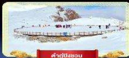
คำกู่ปิงชอน