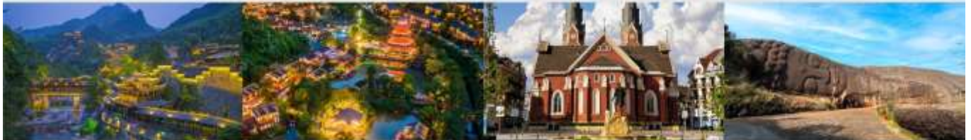
หุบเขาเทวดาวังเซี่ยนกู่