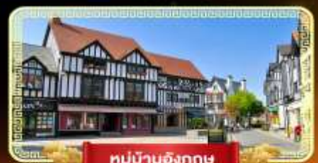
หมู่บ้านอังกฤษ