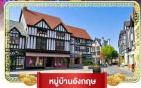
หมู่บ้านอังกฤษ