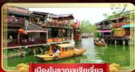
เมืองโบราณซูเจียเจี้ยว

เที่ยวสวนสนุกในฝัน "ดิสนีย์แลนด์" ล่องเรือชมเมืองโบราณซูเจียเจี้ยว