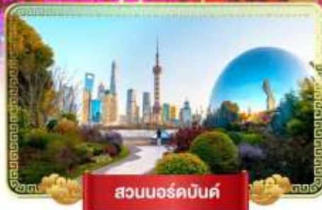
สวนบอร์กันด์

• ถ่ายรูปเช็กอินสวนบอร์กันด์ เดินเล่นชิวเกียนตี้