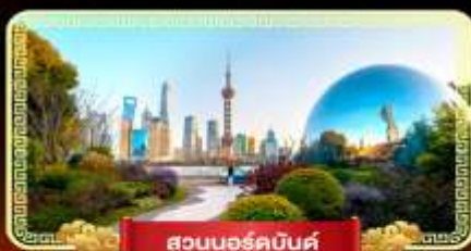
สวนนอร์คบันด์