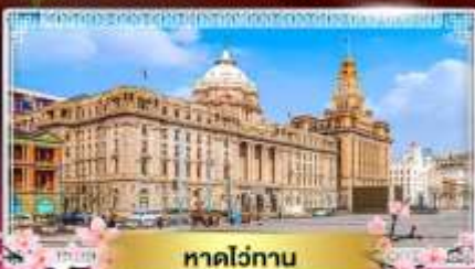
หาดไถ่ทาน

"ชมดอกซากุระนลิบาน ณ แดนมังกร" ล่องเรือทะเลสาบตะวันตก ไข่มุกแห่งหางโจว