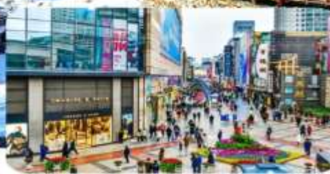
ถนนคนเดินชุนซีถู่