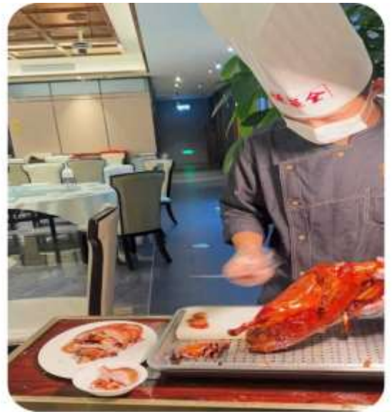
เมนูพิเศษ เปิดปีกกิ้ง

จากนั้นนำท่านเที่ยวชม ถนนโบราณความจำย แปลเป็นไทยได้ใจความ "ซอยกว้างซอยแคบ" เหมือนพาท่านย้อนกลับไปสู่เมืองจินโบราณแต่ผสมผสานกับความทันสมัยเข้าไปได้อย่างลงตัว ถนนคนเดินมี 3 ซอย แต่ละซอยมีความยาวประมาณ 400 เมตร มีร้านค้าเล็กๆ ตั้งเรียงรายอยู่ในแต่ละซอยและตรอกให้เดินช้อปปิ้งกันเพลิน ให้ท่านได้เลือกซื้อ