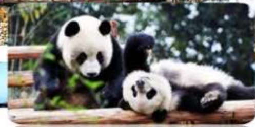
ศูนย์วิจัยหมีแพนด้า

เมนูพิเศษ สุกี้หม่าล่า บุฟเฟต์ / เปิดชกก๊อง