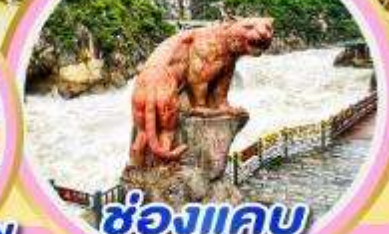
ช่องแคบ เสือกระโจน