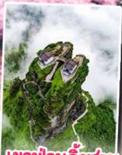
อุทยานกุหลาบพันปี หมู่บ้านแม่วชิเจียง