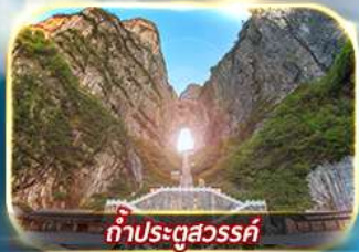
ท่าประตูลั่ว