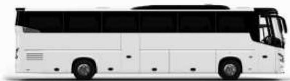
ตัวอย่างรถทัวร์ 1 ชั้น

ค่าที่พักตามที่ระบุในรายการหรือเทียบเท่าระดับเดียวกัน (ห้องพักละ 2 ท่าน) หากประเภทห้องพักท่านริเวสณาเกินจาก เช่น ริเวสคห้องพักเป็น TWIN BED หรือ DOUBLE BED ทางบริษัทขอสงวนสิทธิ์ในการปรับประเภทห้องพัก เป็นตามโรงแรมมีอยู่ โดยไม่ต้องแจ้งให้ทราบล่วงหน้า