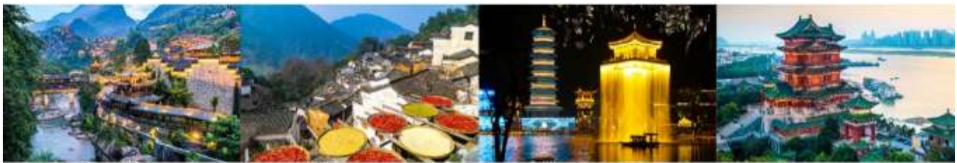
หุบเขาเทวดาฉีเจียนกู่