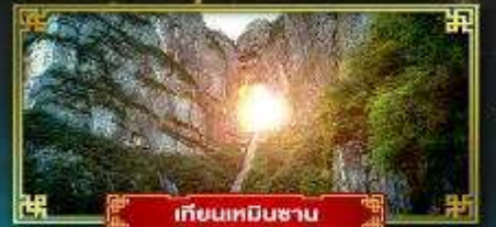
เทียนเหมินซาน