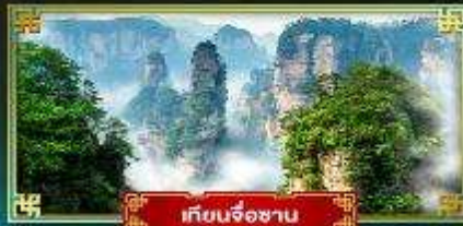
เทียนจ้อซาน