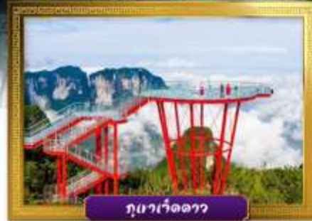
ภูมวเว็ดดาว