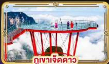
ภูเขาเจ็ดดาว