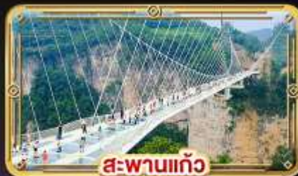
สะพานแก้ว