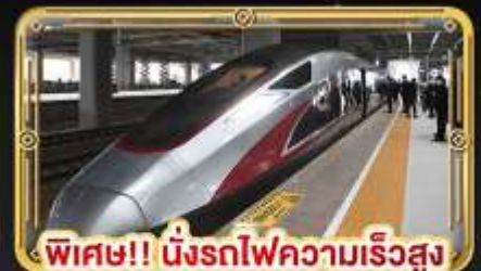
พิเศษ!! นั่งรถไฟความเร็วสูง