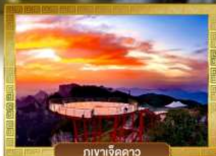
กุเวาเจ็ดดาว