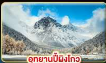
อุทยานปี้ผิงโกว