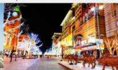
ถนนหวังฝูจิ้ง

*ทางบริษัทฯ ขอสงวนสิทธิ์ในการสลับโปรแกรมทัวร์ตามความเหมาะสมขึ้นอยู่กับสถานการณ์ปัจจุบัน โดยคำนึงถึงผลประโยชน์ของลูกค้าเป็นสำคัญ