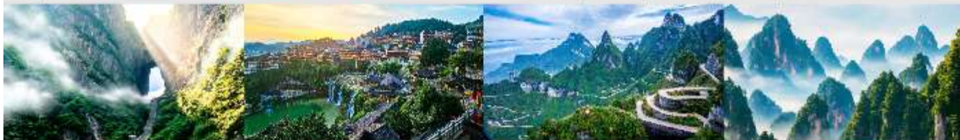
ประตูลั่วหลิง