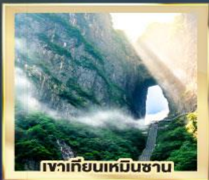
เวาเทียนเหมินซาน