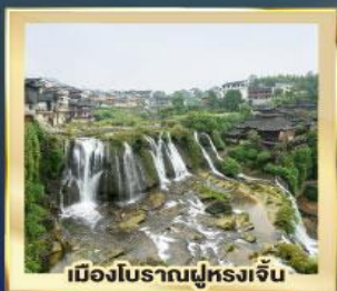
เมืองโบราณฝูหลงเจิน