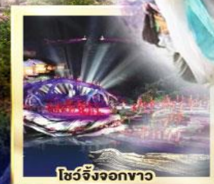
โชว์จิ้งจอกขาว