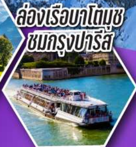
ล่องเรือบาโตมูซ ชมกรุงปารีส

เที่ยวเมืองวาอูซ เมืองหลวงของสาธารณรัฐ ลิกเทินสไตน์