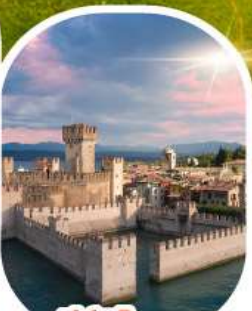
ซีร์มิโอเน