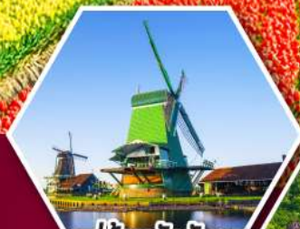
หมู่บ้านกังหันลม ซานส์ทีนส์