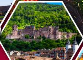
ไฮเดลเบิร์ก