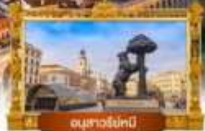
อนุสาวรีย์หนี

เมนู พิเศษ! จิวเวลลอปเปิ้ล + ทุยกับอับเสื่องซี่