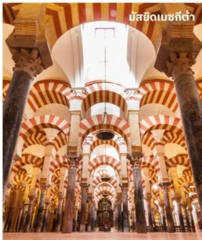
มัซยิดเมซกีต้า

หลังจากนั้นนำท่าน เข้าชมมัซยิดเมซกีต้า ที่มีขนาดใหญ่โตและออกแบบอย่างวิจิตรด้วยการใช้เสาหินจำนวนมากถึง 850 ต้น ต่อยอดเสาด้วยโครงสร้างคานโค้งแบบศิลปะโรมัน ผสมกับลวดลายแบบมัวร์ประดับด้วยเครื่องกระเบื้องเคลือบ อิฐ และหินฉลุลาย กว้างทั้งอาคาร ด้านในสุดของมัซยิดจะสร้างมีหรับ อันเป็นเครื่องหมายแสดงทิศทางของเมืองเมกกะ ต่อมาเมื่อชาวคริสต์เข้ามายึดครองเมืองคอร์โดบา จึงได้มีการสร้างโบสถ์ขึ้นบริเวณกึ่งกลางของมัซยิด และสร้างหอระฆังสูง 93 เมตร ขึ้นในบริเวณสวนส้มและลานน้ำพุ