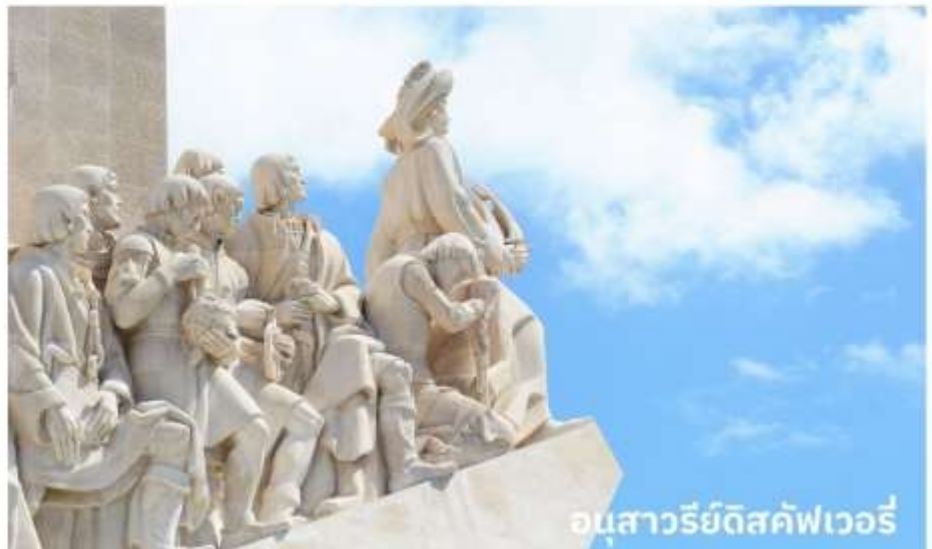
อนุสาวรีย์ดีสคัฟเวอรี