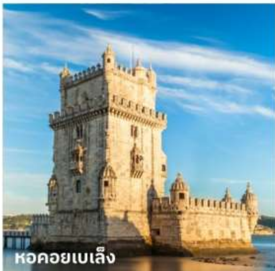
หอคอยเบเล็ง